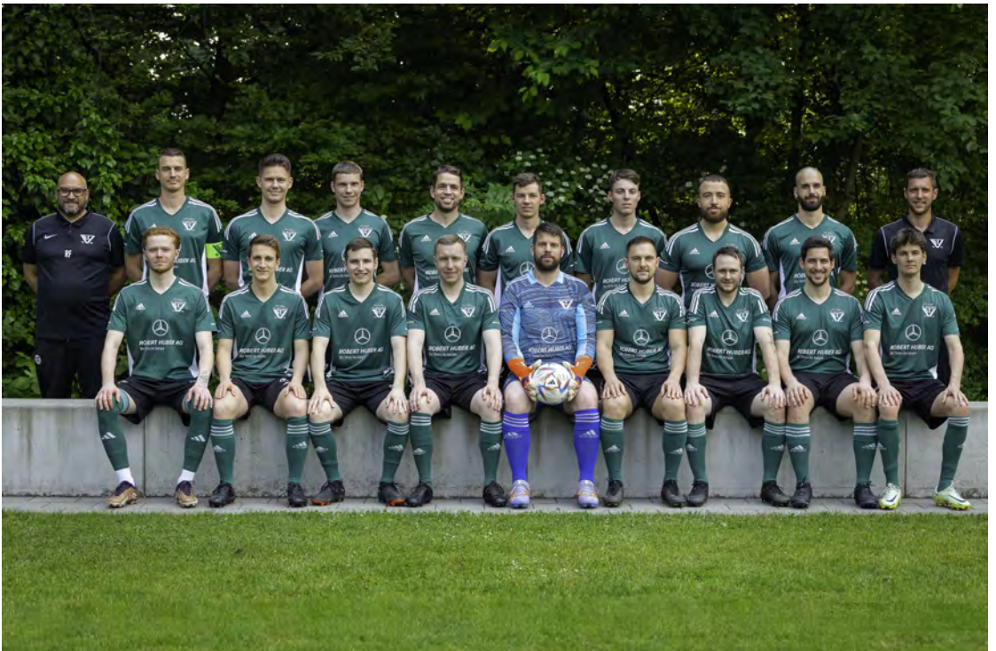
Herzlichen Dank an die Dress-Sponsoren Robert Huber AG, Windisch (1. Mannschaft Bild oben) und Suter + Häfeli AG, Muhen (2. Mannschaft Bild unten)