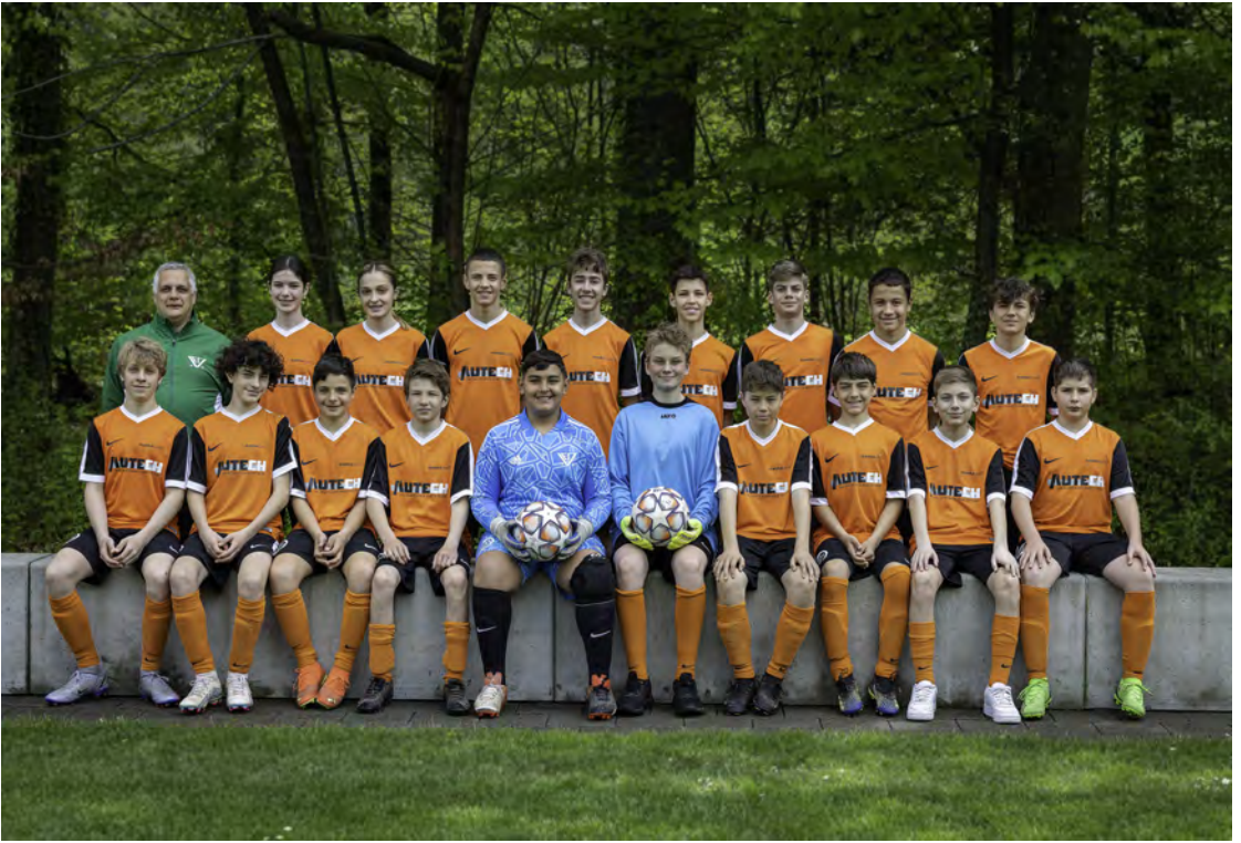
Oben Junioren C / Unten Junioren Ec